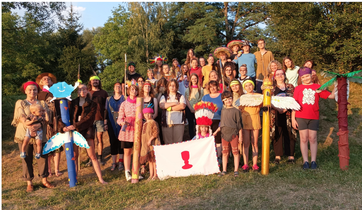
Děti a mládež z olomoucké diecéze na letním táboře Archa