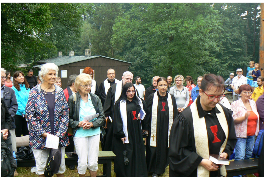
Bohoslužba během diecézní poutě na Ostravici