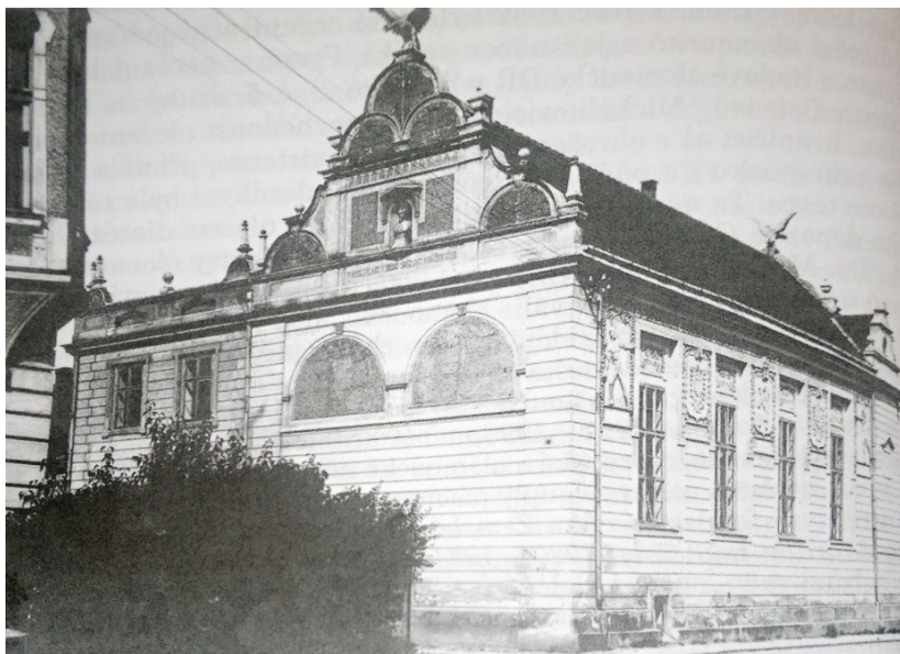
Budova Sokolovny v Litovli, dnešního Husova sboru. Stav před přestavbou. Snímek z roku 1927

Slavnost zahájil průvod s alegorickými vozy. Přijely sem delegace z celé Moravy. Bohoslužby se