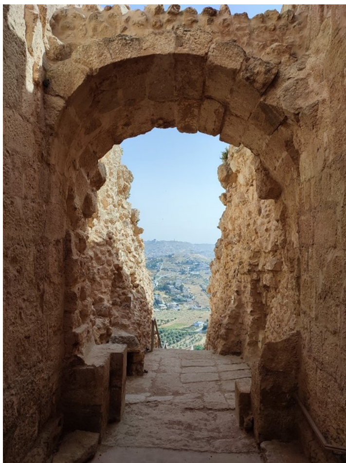
Pohled z Herodovy pevnosti. Izraelci dovedou i poušť zúrodnit.

Duchovní Slezské církve evangelické a. v. (SCEAV) Nemocniční kaplanka v Nemocnici Třinec Koordinátorka nemocničních kaplanů ve SCEAV Koordinátorka duchovní služby ve Slezské diakonii Vystudovala klinické pastorační vzdělávání v Kanadě Začínala jako nemocniční kaplanka na Slovensku Doktorát ze sociální práce a religiozity absolvovala na Komenského univerzitě v Bratislavě.