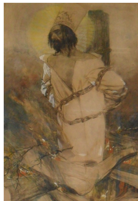
Obraz „Hus na hranici kostnické“ od prof. O. Cihelky z interiéru Husova sboru v Litvli